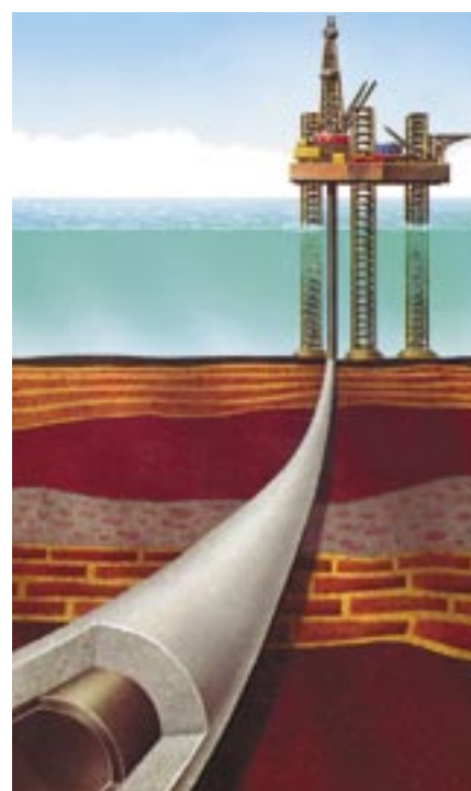
Pozzo petrolifero offshore cementato.